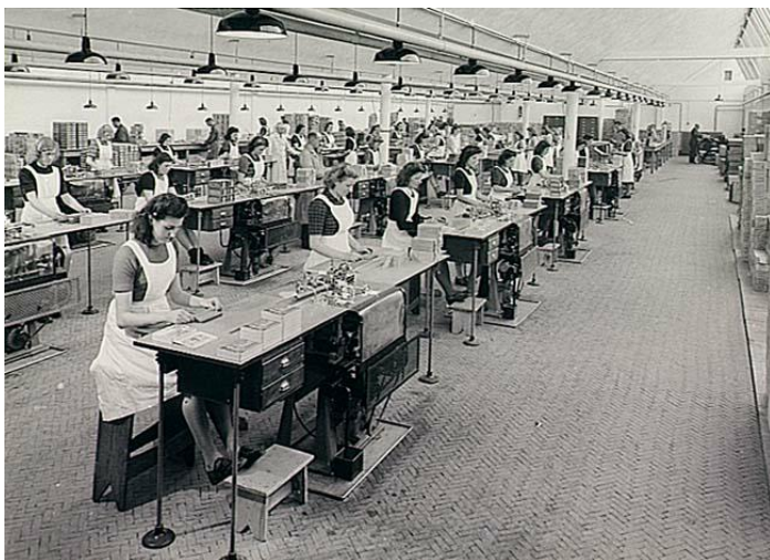
(Meisjes blikken sigaren in, 1955)

In de jaren dertig van de 20 e eeuw moesten veel sigarenfabrieken door de verslechterende economie hun poorten sluiten, wat een groot aantal ontslagen ten gevolge had. Na de Tweede Wereldoorlog ging men volautomatisch produceren. Tot 1960 was het aanbrengen van het dekblad handwerk, daarna konden machines ook deze vaardigheid overnemen. Het aantal arbeidsplaatsen in de sigarenindustrie verminderde daarna snel.