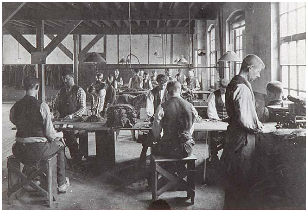
(Fabriek Mignot en de Block, 1905)

Tussen 1873 en 1896 kreeg de landbouwsector de grootste crisis sinds de Middeleeuwen te verwerken. Oorzaak was de sterk toegenomen landbouwproductie in Noord-Amerika. Graan uit Amerika werd tegen sterk concurrerende prijzen in Europa afgezet. De crisis leidde tot een verpaupering van de boerenstand. Vooral de kleine boeren hadden het nu extra moeilijk. Zij leefden op de rand van het bestaansminimum of daaronder. Juist op dat moment diende de sigarenindustrie zich aan en werd daarmee een belangrijke bron van werkgelegenheid in Zuidoost Brabant.