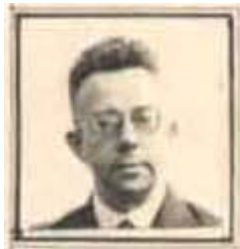
A.A.F. Kop werkzaam op afdeling Algemene Zaken Distributiekantoor Helmond. RHCe: detail collectienummer 109901.