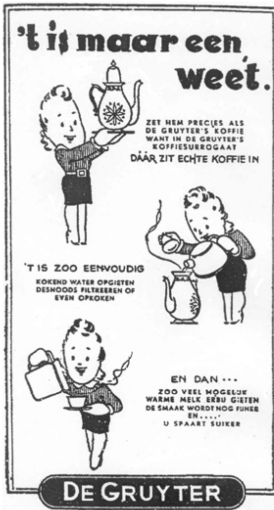
Advertentie voor De Gruyter koffiesurrogaat Zuidwillemsvaart 6 maart 1942.