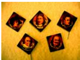
Alle speldjes: RHCe, archief 2252, inv.nr. 5.