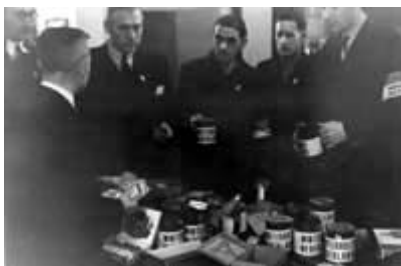
RHCe, fotocollectie nr. 117287; Foto-atelier Prinses.