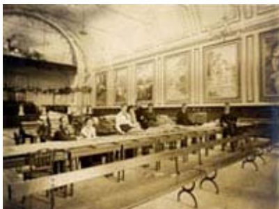
1914-1918 textieldistributie in zaal Geenen aan de Steenweg in Helmond.