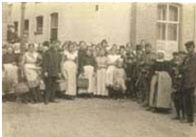
1914-1918 wachtende mensen voor distributiekantoor Havenweg in Helmond.

Eind 1915 worden de voedselproblemen zo nijpend dat de landsregering zich met de distributie gaat bemoeien. Toch duurt het nog tot na de zomer van 1917 dat het distributiestelsel volledig gecentraliseerd worden. Dan wordt in Den Haag gevestigd het Rijks Centraal Administratiekantoor voor de distributie van levensmiddelen. De gemeentelijke distributiekaarten worden veelal afgeschaft en er komt eenheid in het systeem van distributie.