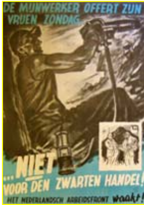
Affiche 1942; RHCe, collectie oorlogsaffiches Helmond, nr. 138; uit archief 2248, doos 564, dossier -1.865.

Over zwarte handel en woeker is al gesproken op de pagina's over voeding. Maar ook bij grondstoffen speelt dit onderwerp zeer nadrukkelijk. Op dit affiche, in 1942 uitgegeven door het Nederlands Arbeidsfront, wordt geageerd tegen de zwarte handel in kolen.