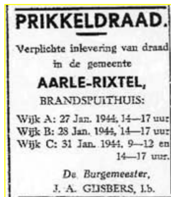
Verplichte inlevering prikkeldraad, Zuidwillemsvaart 28 januari 1944.

Boeren moeten in 1944 ook hun bijdrage leveren aan de honger van de Duitsers naar metaal. Iedere gebruiker van grasland moet vóór 1 februari per hectare 10 meter puntdraad (= prikkeldraad) en 15 meter gladde draad ingeleverd hebben. In plaats van gladde draad mag ook puntdraad ingeleverd worden, maar andersom niet. Hiernaast ziet U de oproep van van loco-burgemeester Gijsbers van Aarle-Rixtel om het prikkeldraad te komen inleveren. In Helmond leverde de vordering 1 kilogram gebruikte gladde draad, 41 kilogram nieuwe puntdraad en 949 kilogram gebruikte puntdraad op.