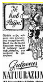
Rechts: Zuidwillemsvaart 3 januari 1944.