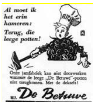
Links: Zuidwillemsvaart 18 januari 1944.

Fabrieken die om verpakkingsmateriaal verlegen zitten, plaatsen zelf ook oproepen aan de consument om het lege materiaal in te leveren. Dit zijn twee voorbeelden van glas, maar in de kranten zijn ook advertenties te vinden van kachelpoets, die te krijgen is tegen inlevering van de leeggeknepen oude tube.