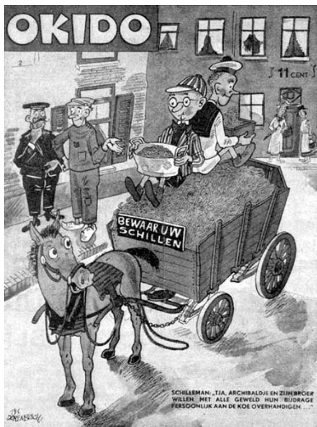
Cartoon schillenboer uit blad Okido RHCe, archief 3180, inv.nr. 99-34.

Tijdens de oorlog is het inleveren van etensresten een verplichting. Al in 1940 wordt dat verplicht gesteld in het Afvalbesluit. Maar er zijn meer afvalstoffen. ROMEA noemt daarnaast oud papier, blik, glas, lompen, oude cocosmatten en menselijk haar.