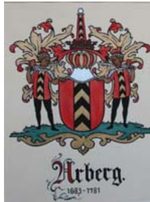
Wapenschild familie Arberg.