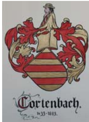
Wapenschild familie Cortenbach.