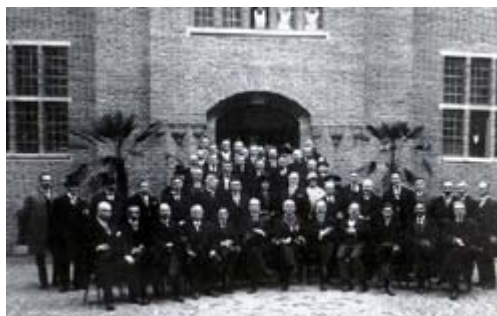
Rechts: statiefoto, gemaakt bij de opening van het kasteel als raadhuis, 5 april 1923.

In de jaren zeventig van de twintigste eeuw werd het kasteel veel te klein voor het groeiende ambtenaren apparaat. Daarom werd niet ver van de oude burcht een modern stadskantoor gebouwd en verdwenen de stadsbestuurders en de ambtenaren weer uit het kasteel. Wel bleef de gemeenteraad in het kasteel vergaderen en bleven natuurlijk ook de trouwerijen. De vrijkomende ruimten werden in gebruik genomen als museum en aanvankelijk ook als archief.