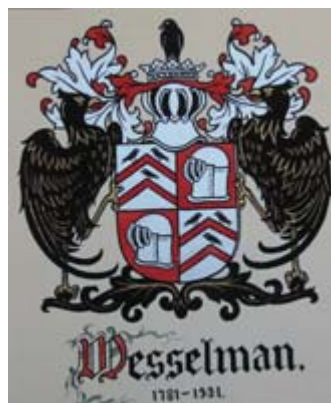
Wapenschild familie Wesselman.