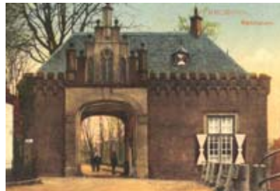
De kasteelpoort, gezien vanuit de Veestraat. De poort is in 1959 afgebroken.

Antoine Udalrique loste de schulden af en voerde een aantal herstelwerkzaamheden uit aan het kasteel. Ook liet hij een nieuwe poort bouwen.