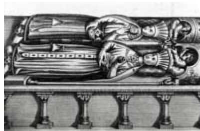
Grafmonument van Maria en haar moeder. Gravure van het graf in de St. Pieterskerk te Leuven.

Maria is vooral bekend geworden als stichtster van het klooster Binderen, een abdij voor adellijke vrouwelijke religieuzen, in 1244 – zie bijlage 5. Aan die stichting is een legende verbonden – zie bijlage 6 -, die verklaart waarom Maria het besluit heeft genomen om het klooster te stichten.