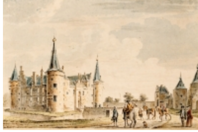
Het kasteel op het einde van de achttiende eeuw. Anonieme aquarel.