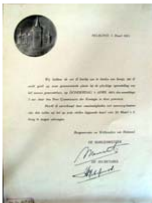
Links: uitnodigingsbrief voor de opening van het gerestaureerde kasteel als raadhuis, 5 april 1923.