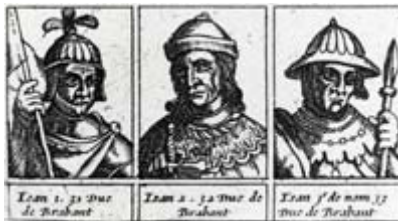
Van links naar rechts de hertogen Jan I, II, en III.

In 1314 droeg de hertog het kasteel met de bijbehorende rechten en goederen over aan iemand anders. Vanaf dat jaar bewoonden achtereenvolgens leden van de families Van Berlaer (1314-1433), Van Cortenbach (1433-1683), Van Arberg (1683-1781) en Wesselman (1781-1920) het kasteel of - als zij dat niet in eigen persoon deden - lieten het bewonen door hun rentmeesters. Zie voor een overzicht van alle heren en vrouwen van Helmond de lijst van heren en vrouwen.