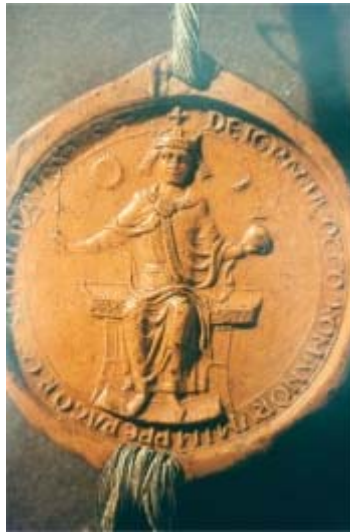
Zegel van Maria van Brabant, ook genoemd van Leuven.

Twee jaar later werd Maria weer uitgehuwelijkt door haar vader, nu aan graaf Willem I van Holland. Ook graaf Willem stierf voortijdig in 1222. Vanaf die tijd woonde de tweevoudig weduwe regelmatig in het "Oude Huys" te Helmond. Zij stierf in 1260.