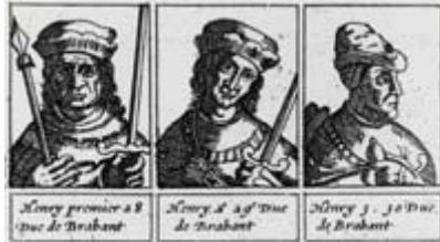
Van links naar rechts de hertogen Hendrik I, II en III van Brabant.