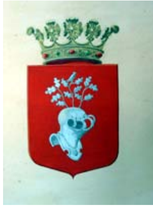
Het huidige gemeentewapen van Helmond, vastgesteld in 1924