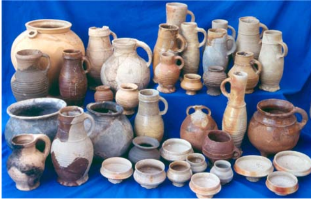
Links: gevonden gebruiksvoorwerpen.