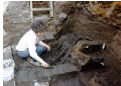
Een archeologe bekijkt de grond tijdens de opgravingen.

Er is bovendien een groot aantal bijzondere voorwerpen gevonden. Heel apart is een klein schaakstuk - zie bijlage 1 - van walrusivoor met een inscriptie aan de onderkant in runentekens (ca. 1150), een drietal kleinere schaakstukken (11de, 12de eeuw) en zes dobbelsteentjes van been. Een van die dobbelsteentjes was bedoeld om vals te spelen: op dit steentje ontbreekt een 3, maar komt tweemaal een 2 voor. Verder is veel materiaal gevonden dat te maken had met oorlog voeren. Genoemd kunnen worden metalen schildbeslag, verschillende soorten bogen en pijlen, maar ook vijf massieve metalen ballen. Deze ballen werden in de middeleeuwen bij belegeringen met behulp van grote houten installaties "afgeschoten" naar de tegenstander. Tenslotte zijn ook veel ijzeren werktuigen gevonden en voorwerpen van meer huishoudelijke aard. De voorwerpen wijzen op rijke bewoners, zoals Maria van Brabant, ex keizerin van het Duitse Rijk.