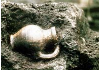
Kan uit de dertiende eeuw, opgegraven in gebied van het poortgebouw van het "Oude Huys". RHCE, fotocollectie nr. 116183.