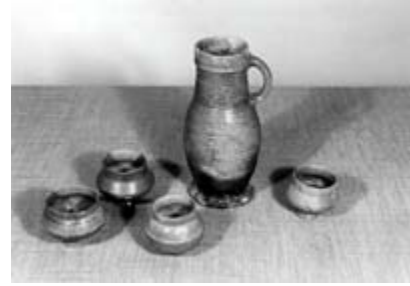
Rechts: servies uit Langerwehe, opgegraven bij het "Oude Huys".